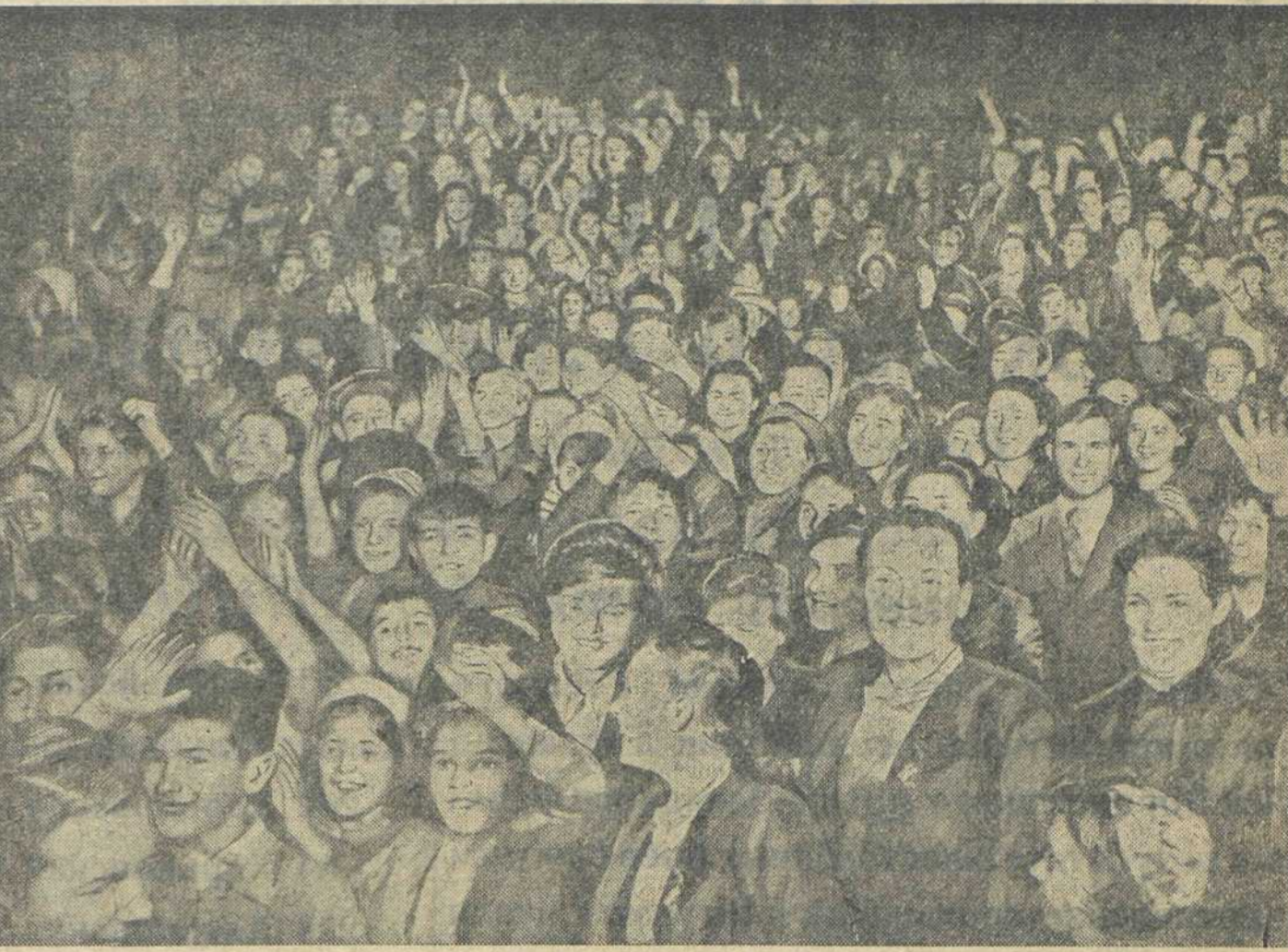
Трудищиеся столицы радостно приветствуют замечательную победу Красной Армии. На снимке: На улице Горького в Москве в момент салюта.

СТАЛИНГРАД, 23 августа. (По телеф. от соб. корр.) Сегодня на всех предприятиях Сталинграда состоялся митинг рабочих, инженерно-технических работников и служащих, посвященный приказу товарища Сталина о взятии доблестными советскими войсками города Харькова. Сталинградцы, работающие в ночных сменах, взяли на себя обязательство показать образцы стахановской работы, достойные блестящей победы воинов Красной Армии.